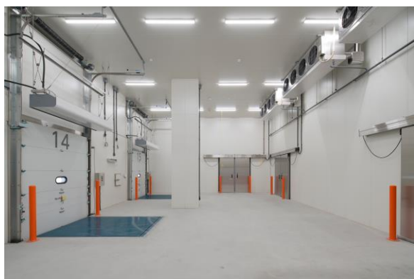
ドックシェルター付保冷库