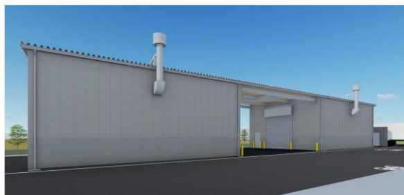
危険品倉庫完成イメージ

なお、加須営業所敷地内には危険品倉庫(延床面積約382㎡)も建設中であり、2024年6月竣工を予定しております。