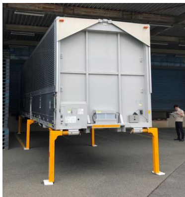
▲スワップ用コンテナ