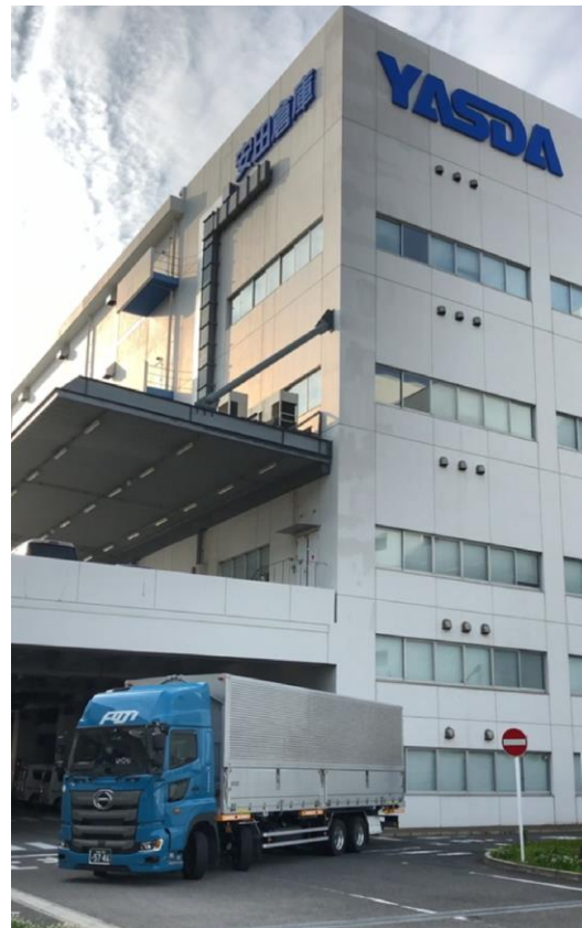
▲コンテナを装着し出発するトラック

当社グループでは、「長期ビジョン2030」において、「世界に誇れるYASDAブランドと革新的テクノロジーの融合で全てのステークホルダーの期待を超える企業グループを目指す」を掲げ、事業を通じた環境負荷低減や高い災害強靱性による持続可能な社会の構築に貢献するため、情報システムの高度化と最先端テクノロジーを活用したDXの推進に取り組んでおります。