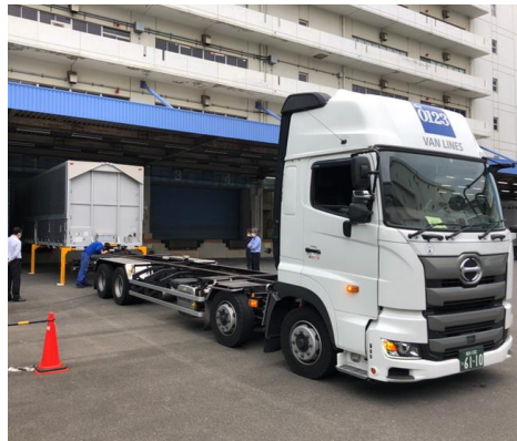
▲コンテナ脱着作業（守屋町営業所）