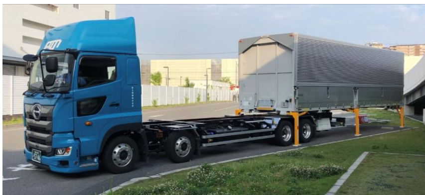
▲シャシーとコンテナの装着作業（茨木営業所）