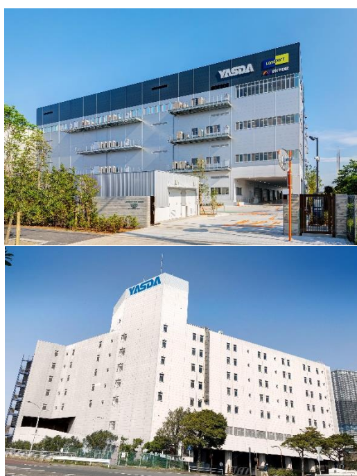
東京メディカルロジスティクスセンター 東雲営業所（上）、（仮称）辰巳営業所（下）

ーメディカルロジスティクスセンターを開設し「医療機器総合ワンストップサービス」を提供ー